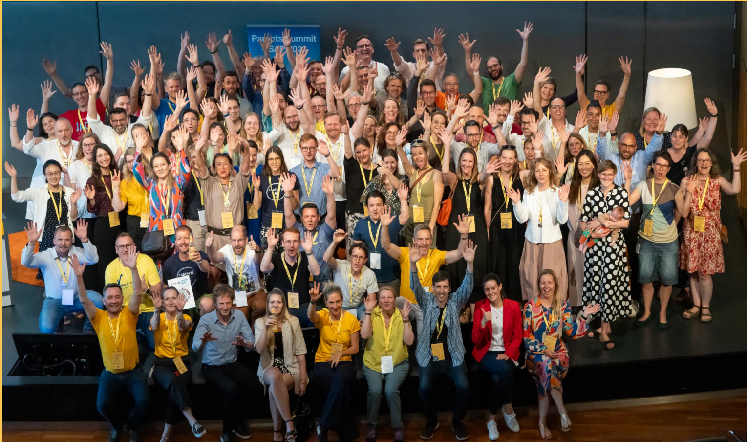
Parents Summit@SAP2023 am 19.06.2023.