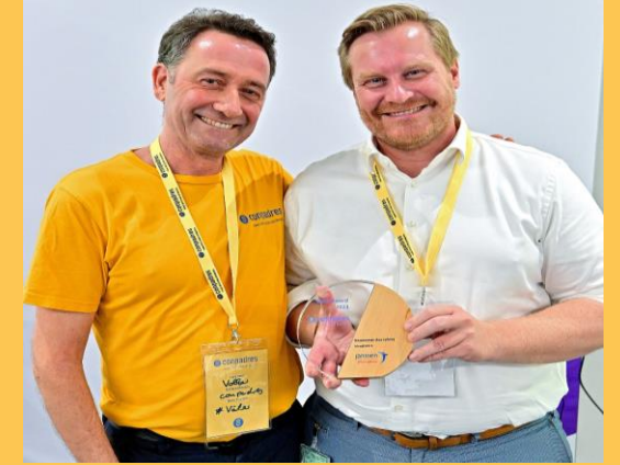
Newcomer des Jahres