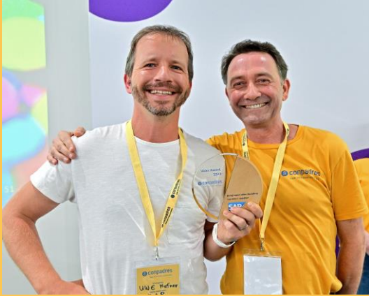
Kerngruppen Vater des Jahres