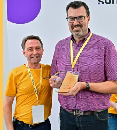
Maßnahme des Jahres